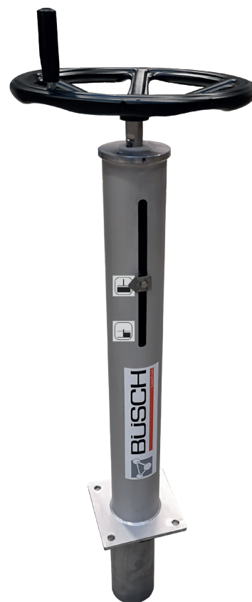
Sloupový stojan s ukazatelem a ručním kolem