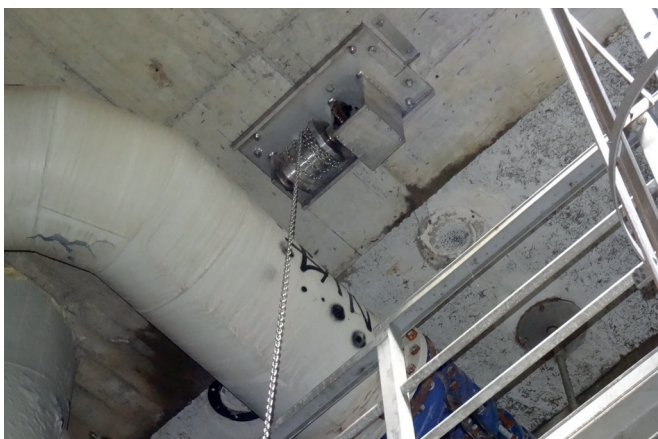
Příklad použití při připevnění hmoždinkami pod stropem.