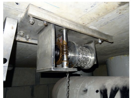
Anwendungsbeispiel zum Andübeln unter der Decke.