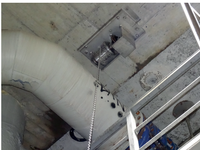
Anwendungsbeispiel zum Andübeln unter der Decke.