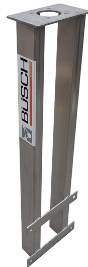
Konsolständer aus Edelstahl