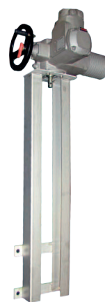
Anwendungsbeispiel mit aufgebautem Elektroantrieb