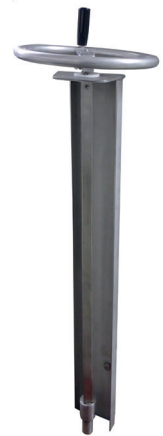
Anwendungsbeispiel mit aufgebautem Handrad