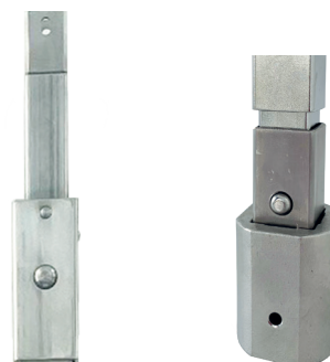
Detailansicht (v. links) aufgesteckte Kuppelmuffen aus Edelstahl Vierkant 12 mm für Hausanschluss und Vierkant 27 mm für Absperrschieber/Absperrarmatur