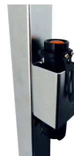
Integrierte Halterung für Taschenlampe