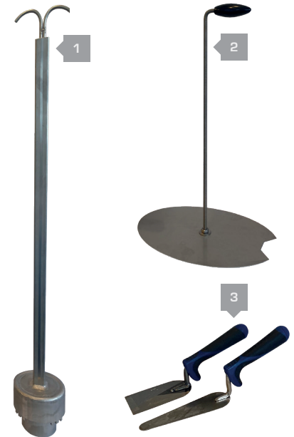
Klauenreinigungsstab (1), Schmutzfangblech (2), Reinigungskellen (3)