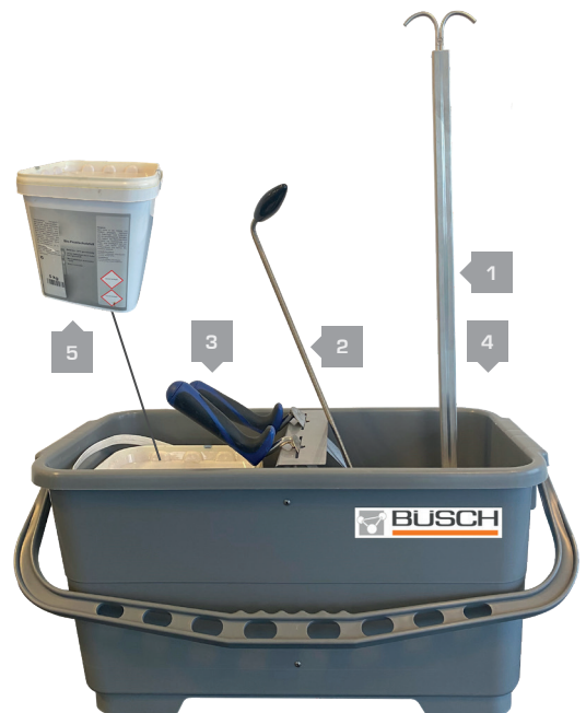
Unterflurhydranten Reinigungs- und Pflegeset

Klauenreinigungsstab in Verbindung mit BÜSCH Kap- penreiniger für ein optimales Reinigungsergebnis der gesamten Straßenkappe