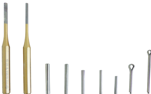
Wybijaki, kołki rowkowe, zawlecзки