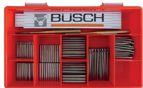
Skrzynia asortymentowa z pełnym wyposażeniem