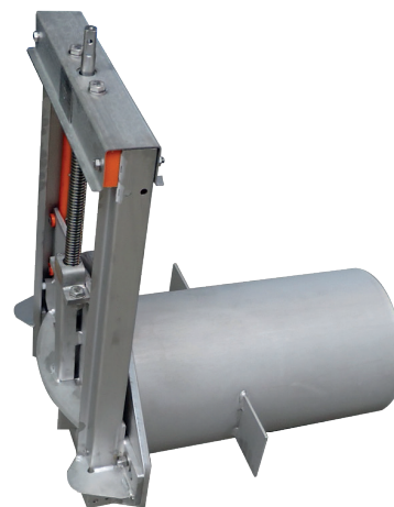
Wandadapter mit montiertem SAFOX® Spindelschieber