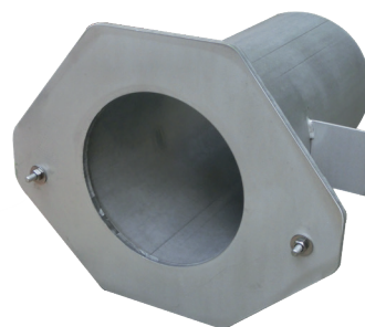
Wandadapter zum Einbetonieren