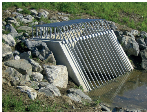
Zahnuté česle na nátokové hraně

Způsoby montáže: připevnění hmoždinkami nebo zabetonování