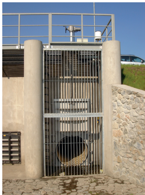
Česle 1800 x 4400 mm před odtokovým šoupátkem